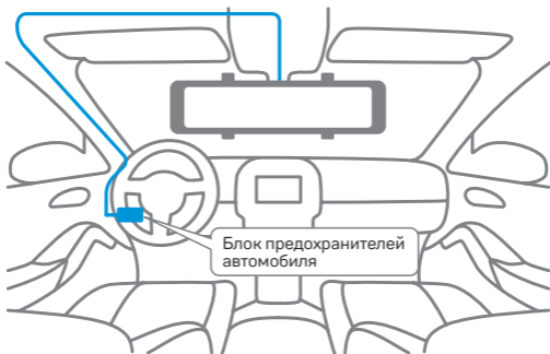
Схема проводки кабеля в автомобиле

Проведите кабель питания к блоку предохранителей, как показано на иллюстрации